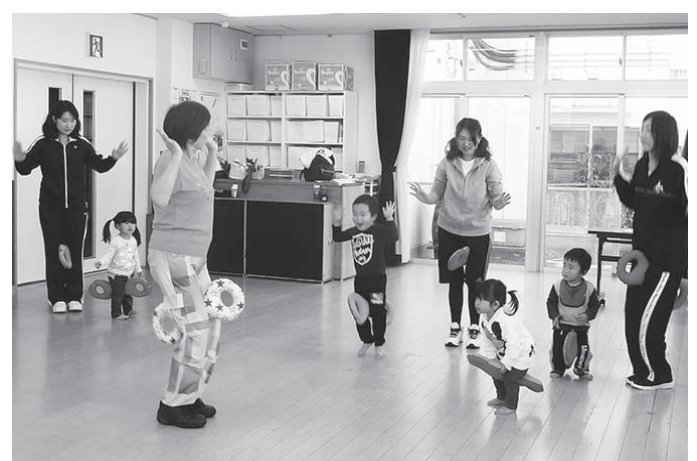
塙山交流センターで活動している幼児サークル(ひまわりの会)

平成最期の新年を迎えた塙山交流センターは、一月四日に放課後児童クラブ「塙山こどもわくわく広場」の児童たちの「明けましておめでとうございます」の挨拶で始まりました。また、八日からは新学期も始まり、毎週水曜日に開設している放課後子ども教室「ワンデイクラブ」も再開し、明るく、元気な子どもたちで賑わいました。当会が市より指定管理を受けて運営している塙山交流センターでは、就学前の子どもたちを対象にしたグループの利用もたくさんあり、次の時代を担う子どもたちを見守ります。