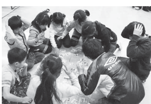
真剣なまなざしで今にも飛びつきそう

かるたは「日立郷土かるた」を使用、子どもたちは、大会に向けて何回も練習を重ね、これまでの練習の成果を発揮しようと、手元のかるたを食い入るよう見つめ、読み札が読まれるのを今か今かと待っていました。札が読まれると、一斉に勢いよくかるたを取る姿に歓声が湧き、元気な声が響きわたりました。